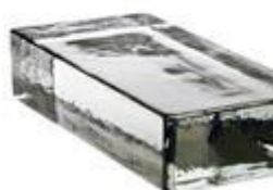
NEUTRO Artikel Nr.: 117195 24 x 11,7 x 5,3 cm