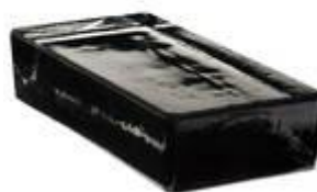
NORDICA Artikel Nr.: 117193 24 x 11,7 x 5,3 cm