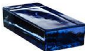
BLAU Artikel Nr.: 117194 24 x 11,7 x 5,3 cm