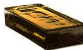
SIENA Artikel Nr.: 117192 24 x 11,7 x 5,3 cm