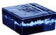
BLAU Artikel Nr.: 117200 12 x 11,7 x 5,3 cm