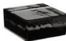
NORDICA Artikel Nr.: 117196 12 x 11,7 x 5,3 cm