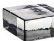
NEUTRO Artikel Nr.: 117201 12 x 11,7 x 5,3 cm